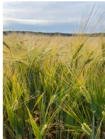
Fot.: Jęczmień ozimy Esprit