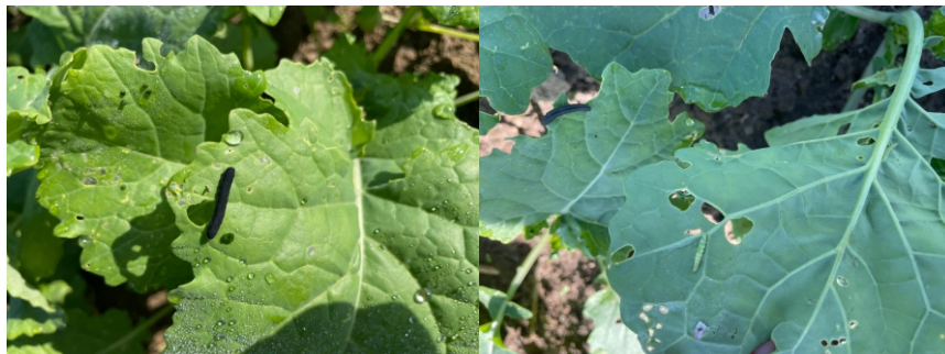
Fot.powyżej: Larwa gnatarza rzepakowca na Fot.powyżej: Gąsienica tantsisia krzyżowiaczka żerująca na liściu rzepaku.

Warto również dodać mikroelementy: Super 5+ 2 kg/ha i Profi Bor 2 l/ha